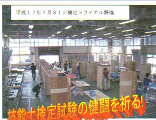
平成17年7月31日検定トライアル開催